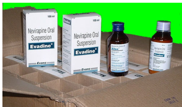
Las patentes estrictas sobre los medicamentos han suscitado preocupaciones a sobre el costo de los fármacos para luchar contra el VIH/SIDA

En el punto de la Observación General que trata de las condiciones para la aplicación, por los Estados Partes, del apartado c) del párrafo 1 del artículo 15 se afirma que la aplicación precisa para garantizar disponibilidad, accesibilidad y calidad de la protección dependerá de “las condiciones económicas, sociales y culturales que prevalezcan